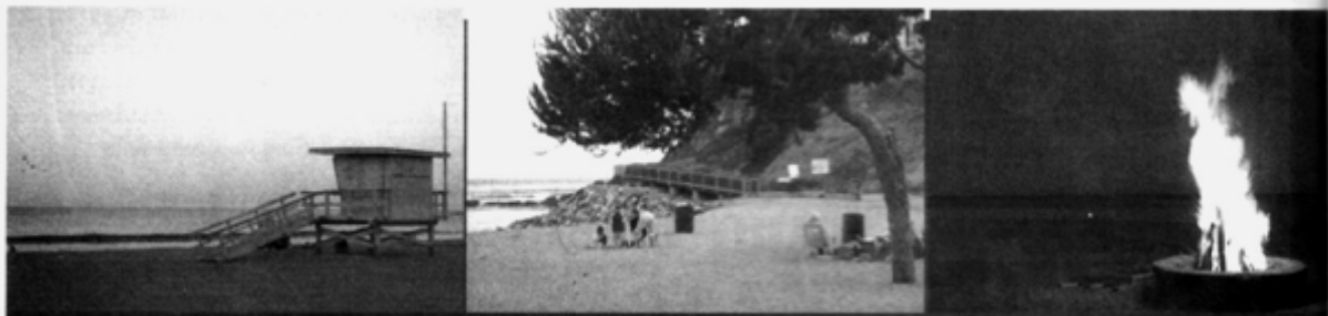
▲ ยามโพลเพลบนหาดคาบริลโล

ถึงเดือนสิงหาคม จะพร้อมใจกันยกพลเป็นหมื่นเป็นแสนตัวขึ้นมาวางไข่บนหาดต่างๆ ตลอดแนวชายฝั่งแคลิฟอร์เนีย โดยไถ่มาพร้อมกับคลื่น วิธีการก็คือตัวเมียจะดันตัวขึ้นเป็นแนวตั้ง พร้อม