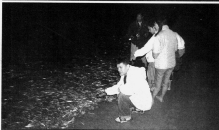
▲ ปลากันเนี่ยนับหมื่นนับแสน ขึ้นมาวางไข่ให้ดูกันแบบใกล้ชิด

ส่วนใหญ่เป็นตัวผู้ หากไม่มีอะไรผิดปกติกันเนี่ยนตัวอื่นๆ ก็จะทยอยตามขึ้นมา เริ่มจากเป็นสิบ เป็นร้อย เป็นพัน เป็นหมื่น และเป็นแสนตามลำดับ