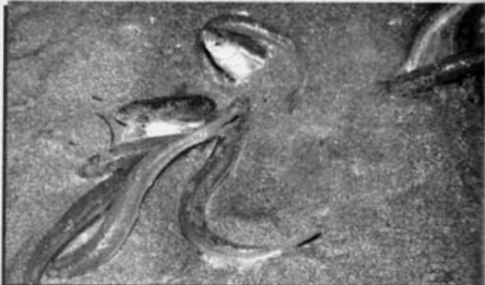
▲ ที่โผล่มาแค่ครึ่งตัว คือกวันเนี่ยนตัวเมียกำลังไข่ โดยมีตัวผู้คอยรอมๆ